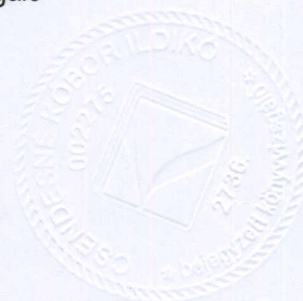
Csenedesné Kóbor Ildikó Bejegyzett vállalkozási-, pénzügyi- és költségvetési minősítésű könyvvizsgáló Reg sz.: 002275