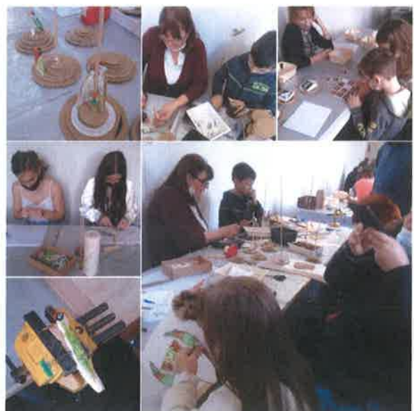
Pillanatképek az Év élőlényei, ásványa és ősmaradványa 2022 rendezvényről