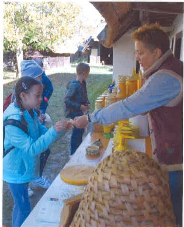
Pillanatképek az Állatok világnapja rendezvényről