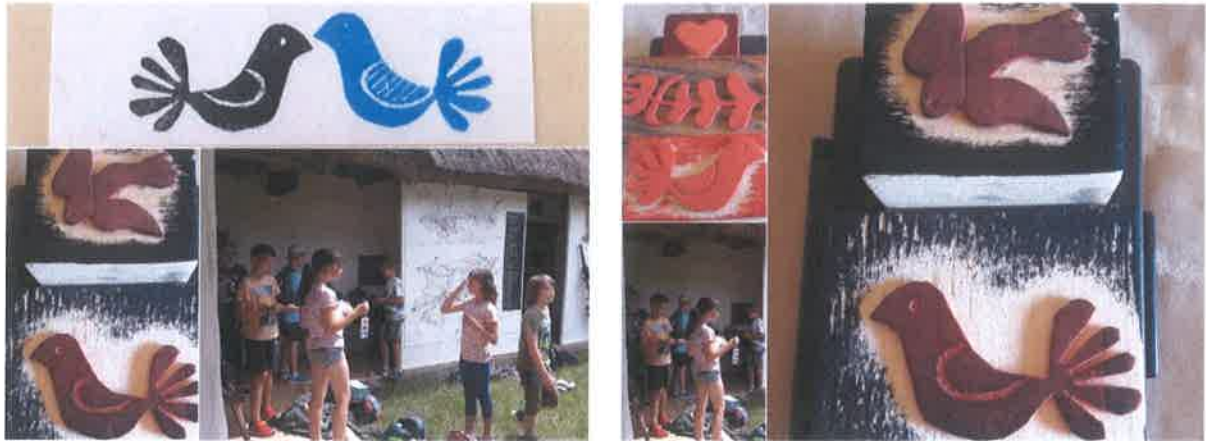
Pillanatképek a Madarak és fák napja rendezvényről