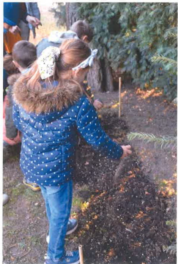
Pillanatképek a Beporzók napja rendezvényről