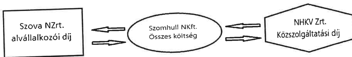
1. ábra: Az alvállalkozói díj és a közszolgáltatási díj képezik működésünk alapját.

A Szova 2021-es évben a 3,92 Ft/L alvállalkozói díjat 4,05 Ft/L-re emeli, ez fent vázolt költségeinkben ~3,2%-os többletet fog eredményezni. Ezen felül költségváltozással nem számolunk a 2021-es évben, ami költségekben kifejezve ~30 millió forintos növekedést jelent változó költségeink terén.