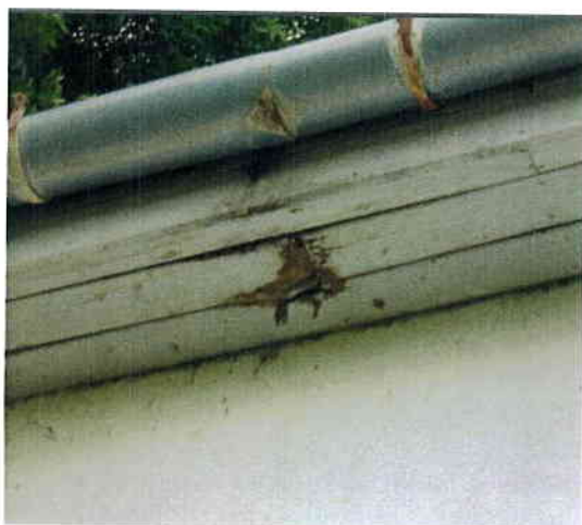
eresz csatorna lukas, deszkázat elkorhadt.