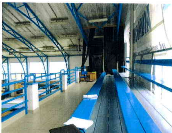
emelet lelátó rész,

Tornacsarnok épület műszaki üzemeltetésének, éves költségek meghatározása.