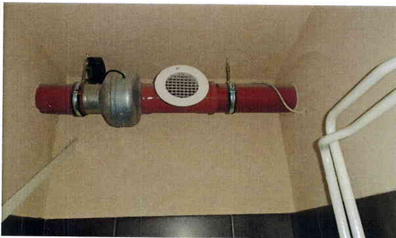
Öltözőkbe kiépített légelszívó,