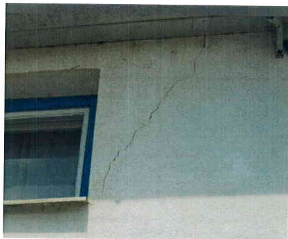
eresz csatorna lukas, deszkázat elkorhadt., Emeleti rész, iroda ablaknál repedés,