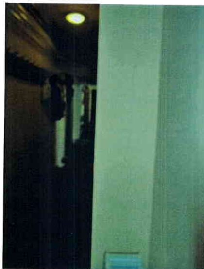
Folyosón a bejáratnál a falon repedés,