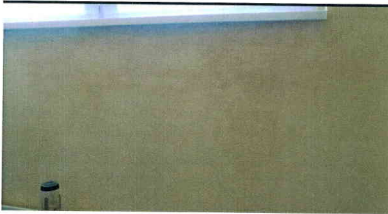
Öltöző ablaka alatti vizesedés, beázás (már száradt)