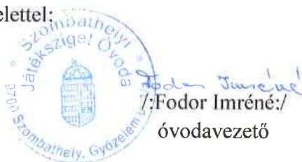
/:Fodor Imréné:/ óvodavezető