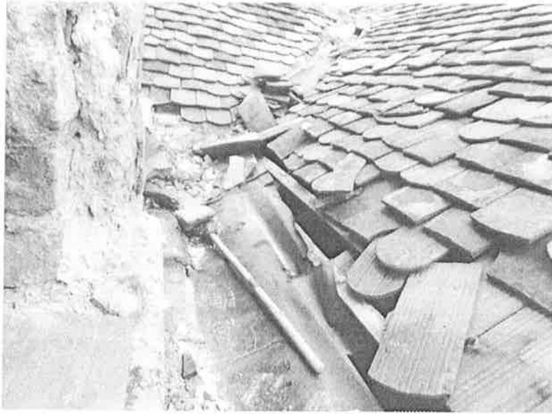
1. ábra Tönkrement tetőburkolat és ereszcsonna az emeleti helyiség külső falzatánál