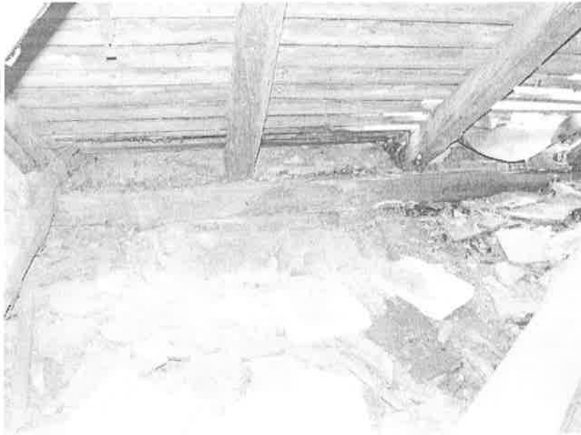
3. ábra Beázás a tetőszerkezetben 2