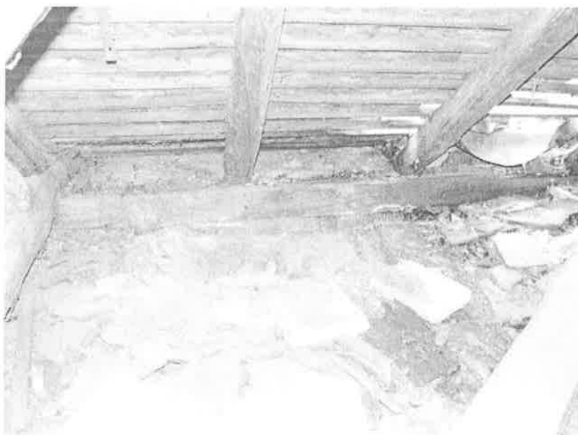
3. ábra Beázás a tetőszerkezetben 2