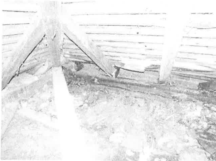
2. ábra Beázás a tetőszerkezetben 1