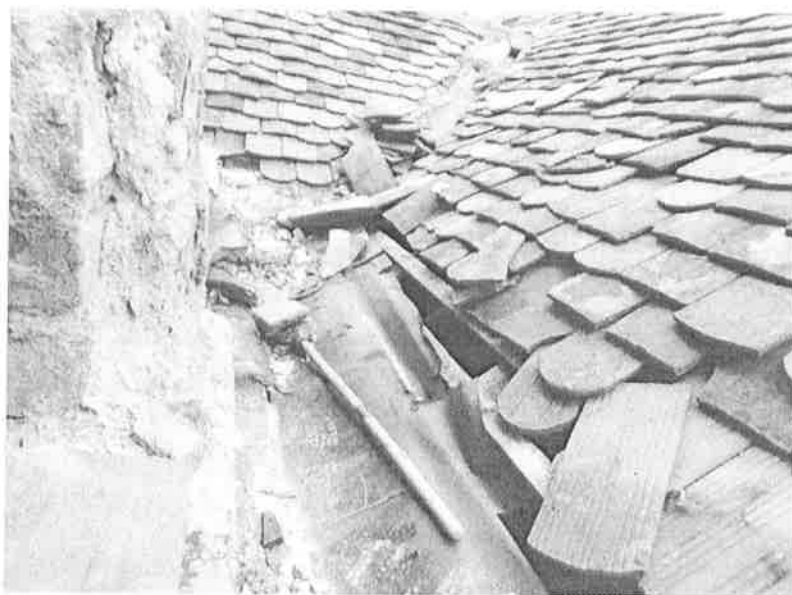
1. ábra Tönkrement tetőburkolat és ereszcatorna az emeleti helyiség külső falzatánál