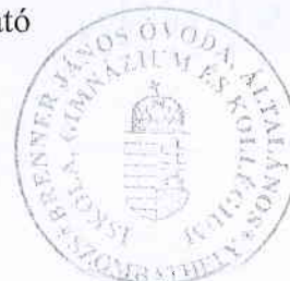
Englert Zsolt igazgató