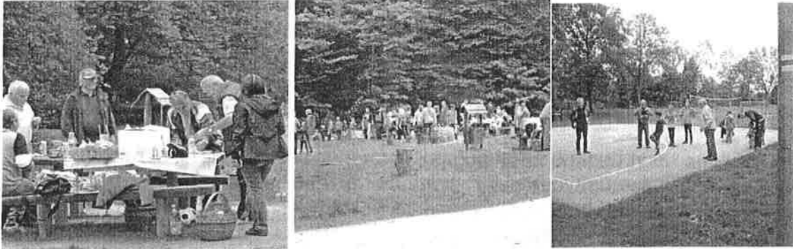
családi nap a parkerdőben

A pályázat egyik célja a generációk közötti együttműködés megvalósítása, mely keretében az Aranykorúak Sport és Kulturális egyesülettel, az ÖrökSégünk Alapítvánnyal jól sikerült családi közös sportnapot, ügyességi vetélkedőt szerveztünk a parkerdőben.