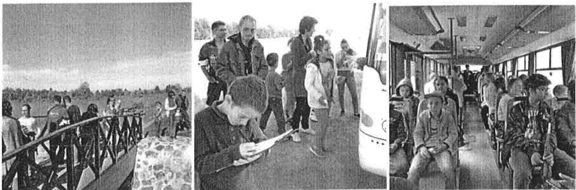
Kirándulás a Lukácsházi víztározóhoz

Házi csocsó-verseny lebonyolításával a gyermekek játékos és felügyelt, irányított keretek közt gyakorolhatják többek közt az együttműködést, a kezdeményezőképeséget. A tanulók önismeretének, pozitív jövőképeinek fejlesztése érdekében csoportfoglalkozásokon szerepjátékokat tartott egy drámapedagógus. Pályaválasztás segítése érdekében elvittük a gyereket a tűzoltóságra, a MAM Vaskeresztesi gyárba. Kirándulásra vittük őket a Lukácsházi víztározóhoz, ahol egy horgász a halakról, halászat – horgászatról adott tájékoztatást.