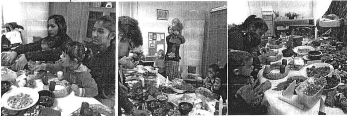
kézműves foglalkozás a Nagycsaládos Egyesületben

A karácsonyi ünnepekre készülődve az Alpokalja Nagycsaládos Egyesülettel szervezett közös program kézműves foglalkozásán a résztvevők adventi koszorút, az ajtóra kopogtató díszet tudtak készíteni, s a munka befejezése után a résztvevők finom ebédet kaptak.