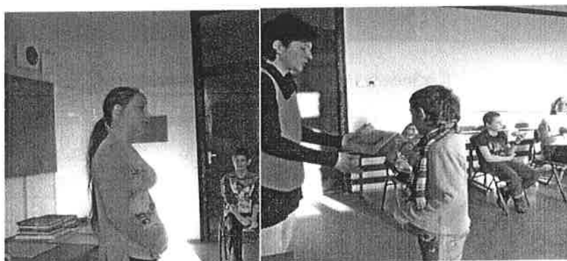
Arany János szavalóverseny – emléklap és díjátadás

Kiállításokra vittük a gyereket. Arany János emlékévé keretében „Arany János” szavalóversenyt szerveztünk, és a résztvevőknek emléklapot adtunk. Karaoke versenyt is csináltunk a gyerekeknek.