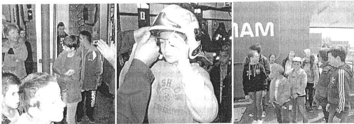
A Tűzoltóságon és MAM üzemlátogatáson