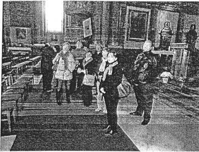
A székesegyházban -