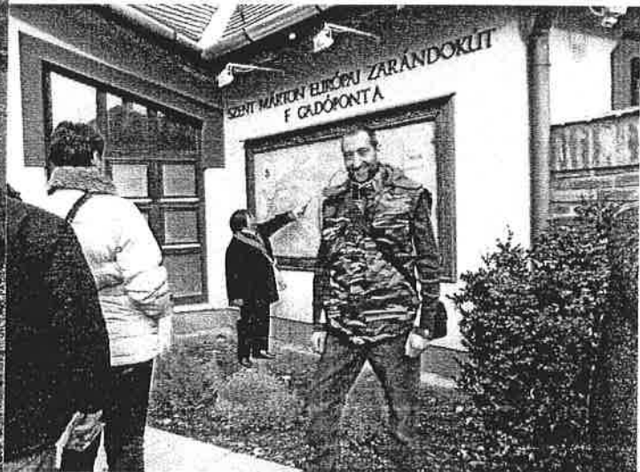
Martineum udvarán – a Szent Márton sétaút kiinduló pontja