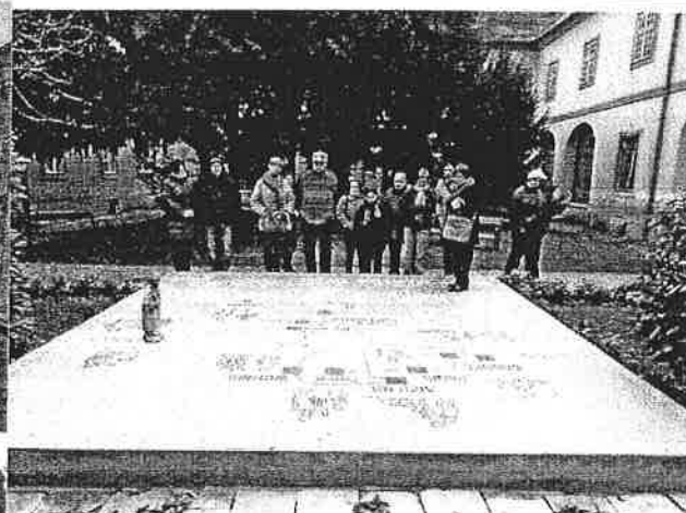
Bobai Y's Men Klub tagjaival a Szent Márton templomban és látogató központban