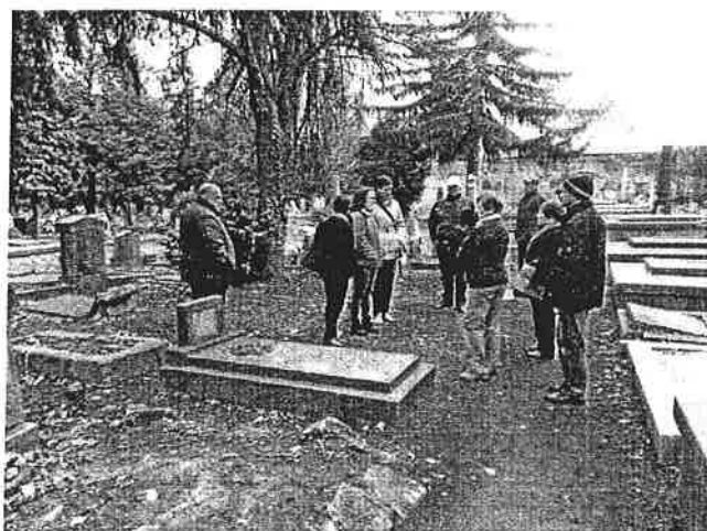
néhány régi síremléket.