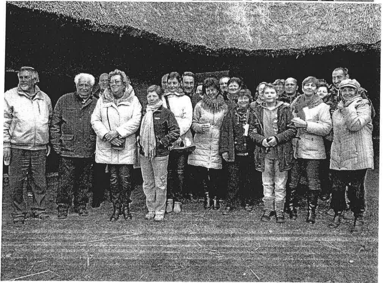
Bobai klub tagjai délután kijöttek a vásárba