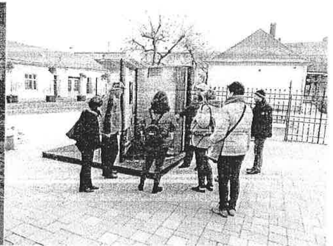
az evangélikus templom előtti „nagy könyv”