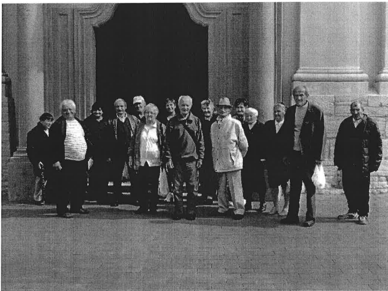
Szombathely; 216. szeptember 20.

Örömünkre szolgál, hogy részesei és segítői lehettünk a mai napnak, mellyel - Szombathely szülöttének - Szent Mártonnak életére és cselekedeteire emlékeztünk.