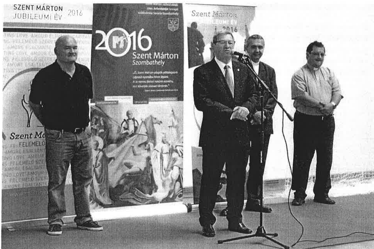
Ma azért jöttünk össze, hogy Szent Mártonra emlékezzünk és közben sportoljunk a fair play