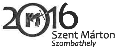
Szent Márton Szombathely