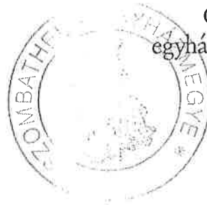
Császár István egyházmegyei kormányzó