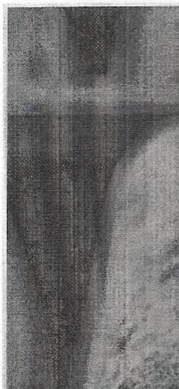
Pásztor Ágnes adománya

Intézkedés: program megtervezése, személyes megkeresés