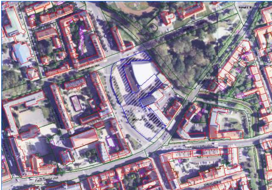
1. ábra: Légifotó a tervezési terület jelölésével