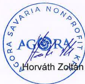
ügyvezető AGORA Savaria Nonprofit Kft.

A 342/2023. (X.26.) Kgy. számú határozattal Szombathely Megyei Jogú Város Közgyűlése döntött a helyi identitás kampány erősítéséről, melyben társaságunk is részt vett. Ezt a szándékunkat a 2024-es üzleti tervünkben jeleztük. Az identitáskampánnyal járó kiadásaink 12 m forintra tehetők.